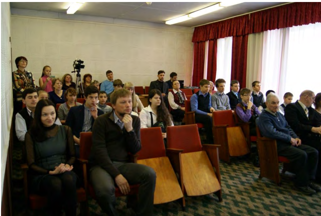
Участники церемонии награждения победителей краевого смотра-конкурса проектов и программ школьных музеев и патриотических клубов в образовательных учреждениях Камчатского края