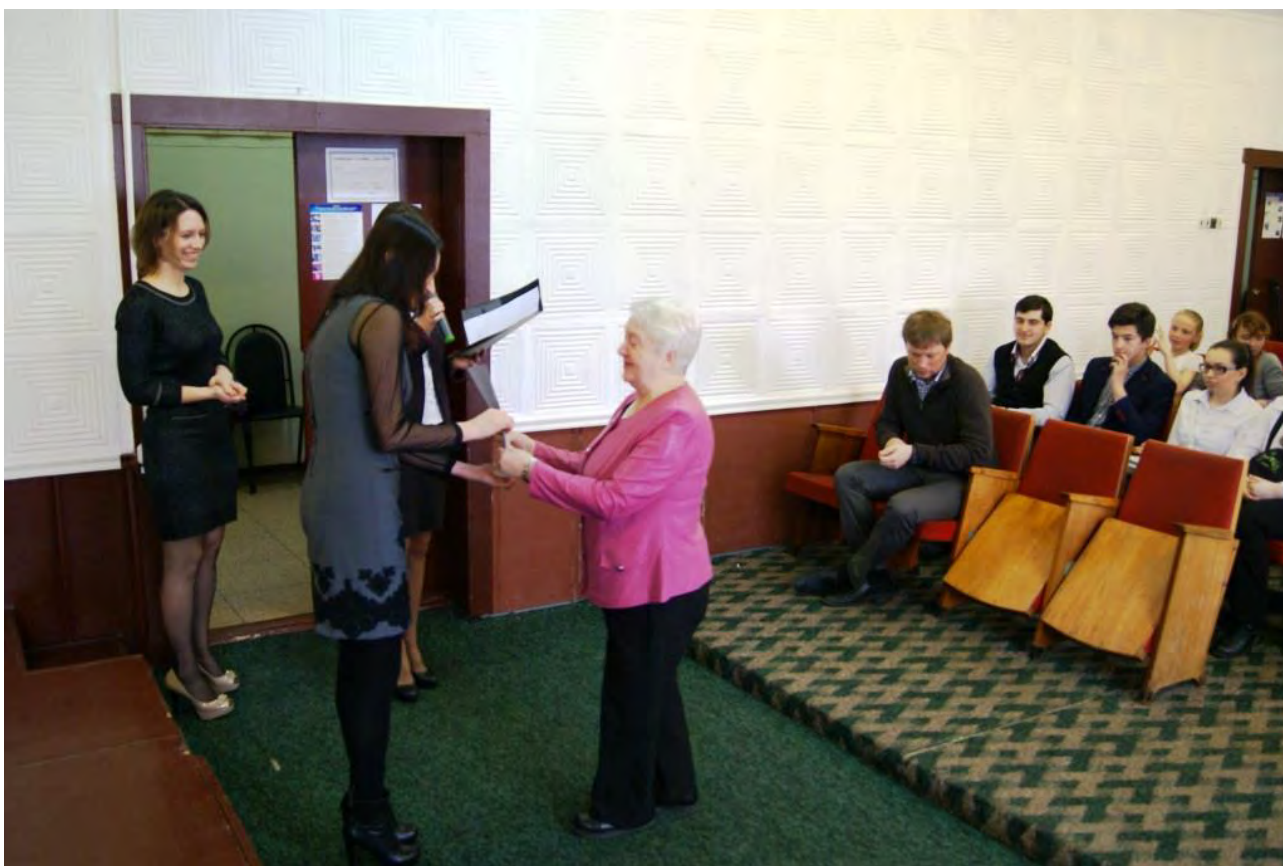
Награждение победителей краевого смотра-конкурса проектов и программ школьных музеев и патриотических клубов в образовательных учреждениях Камчатского края