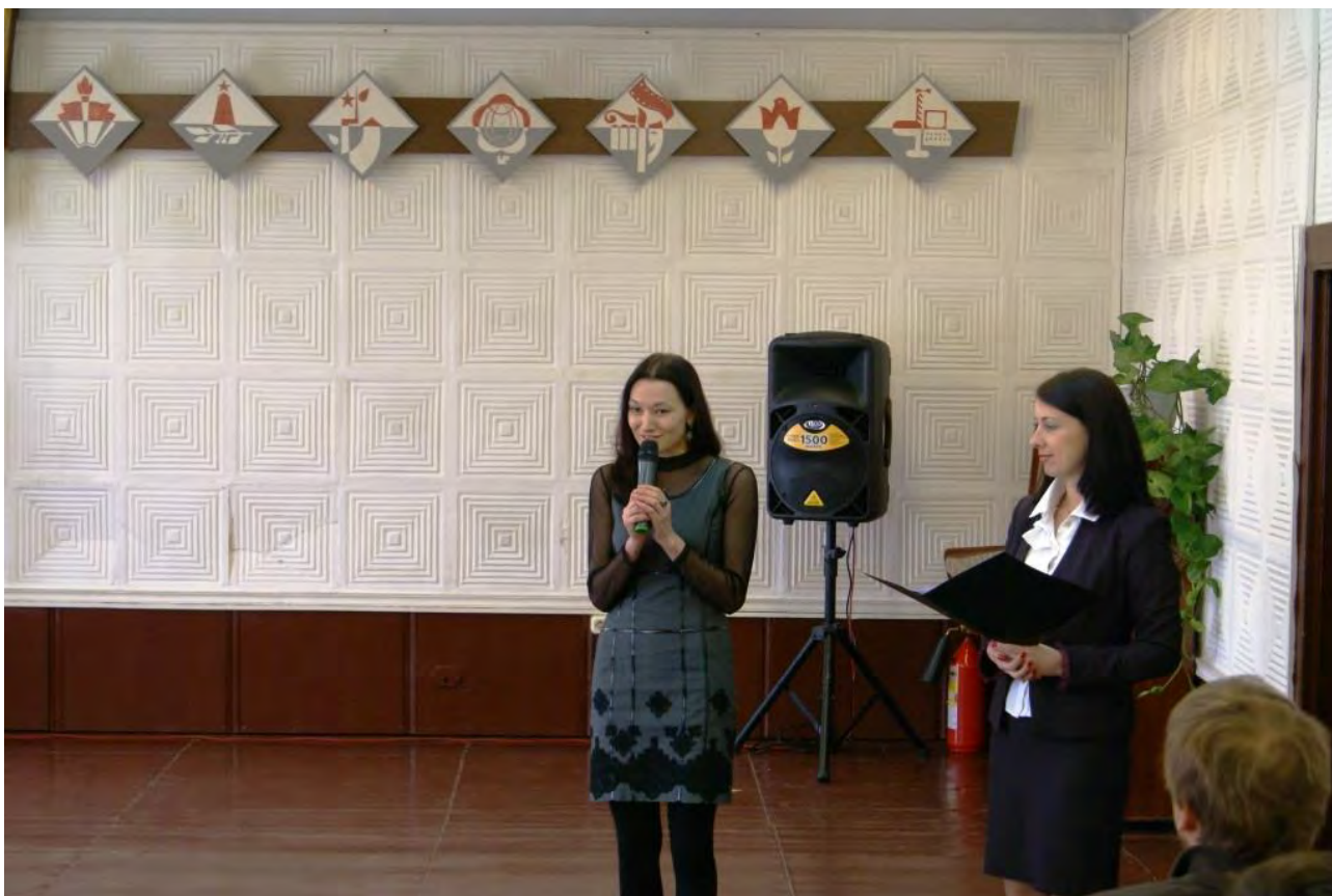
Выступление консультанта отдела воспитательной работы и дополнительного образования Министерства образования и науки Камчатского края